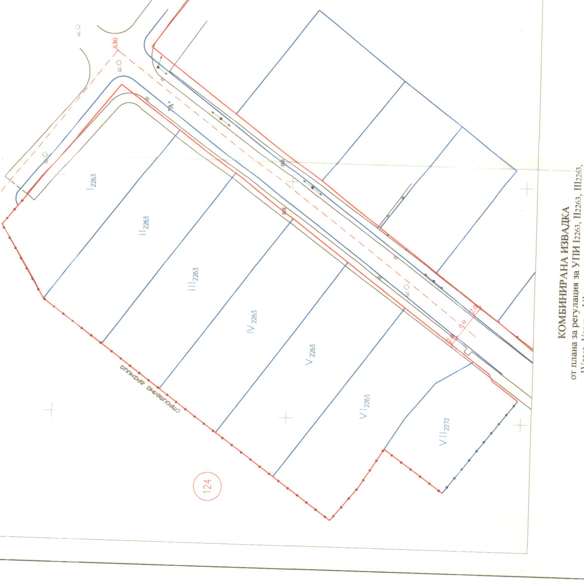
КОМБИНИРАНА РЕШЕНИЕ на УПИ 1226, Ш263, П2263, IV2263, V2263 и VI2263 по плана на гр. Стрелча, община Стрелча, област Пазарджик с геоинженерно решение. М 1:500