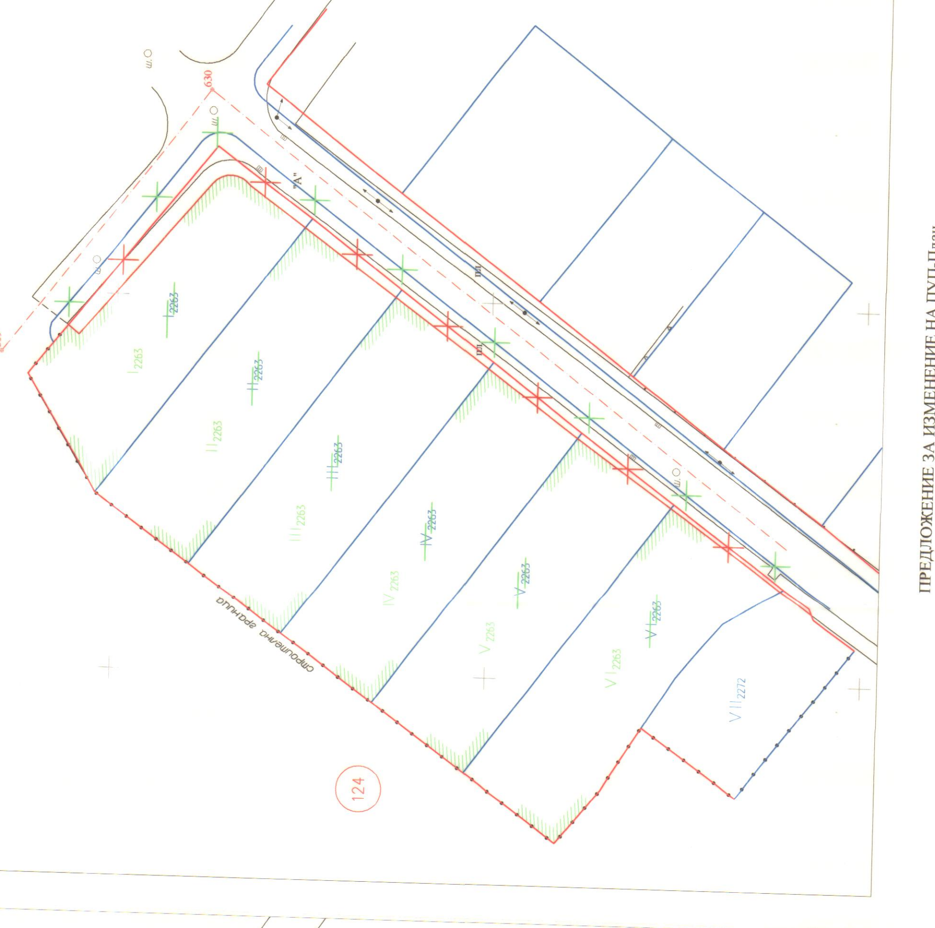
ПРЕДЛОЖЕНИЕ ЗА ИЗМЕНЕНИЕ НА ПУП-ПЗ на УПИ 1226, Ш263, П2263, IV2263, V2263 и VI2263 по плана на гр. Стрелча, община Стрелча, област Пазарджик. М 1:500